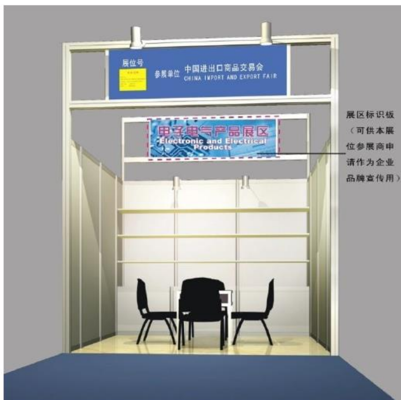
第134届广交会标摊展位增加标识板效果图

2. 现场申报：为方便您的申报工作的顺利进行，请您在开展前一天的12:00前到客户服务中心现场服务点办理申请和交费。